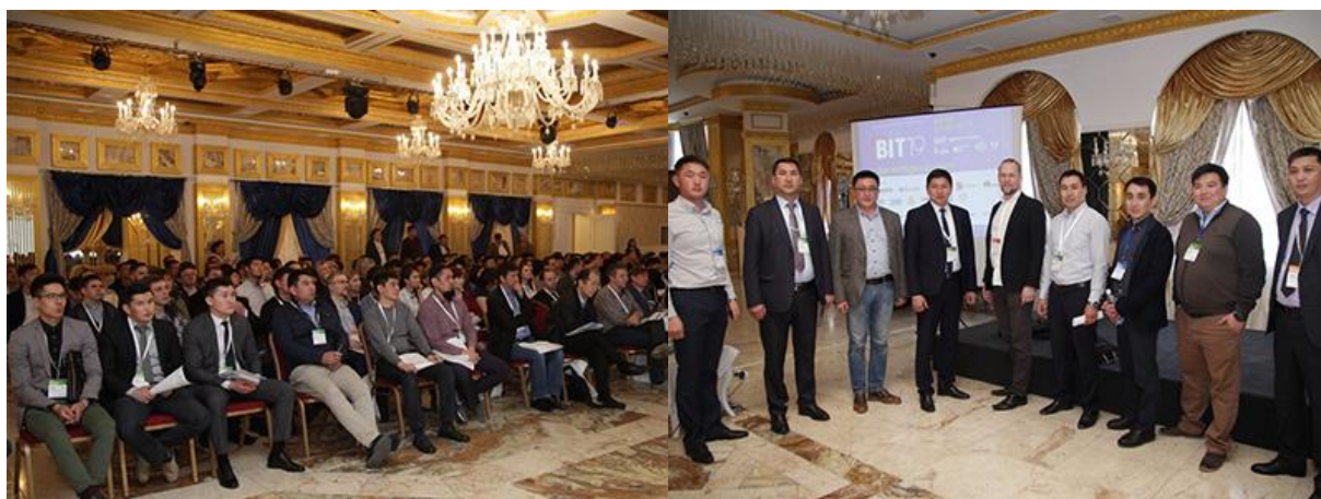
Международный Форум БИТ-2019 в Бишкеке собрал 277 участников

Форум представляет собой удобную площадку для коммуникаций , объединяющую наиболее инициативных представителей отрасли. Отметим, что в этом году форум посетили 277 участников!