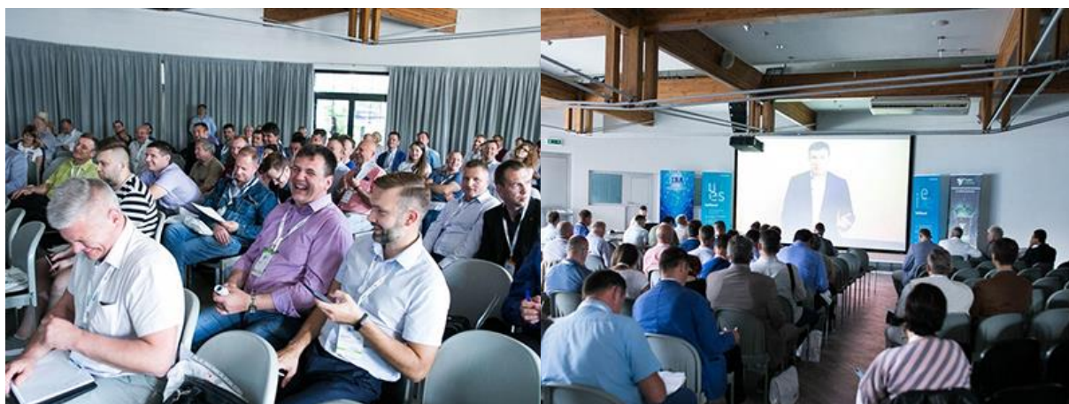
Международный Форум ВIT-2019 в Минске собрал 253 участника

Форум представляет собой удобную площадку для коммуникаций , объединяющую наиболее инициативных представителей отрасли. Отметим, что в этом году форум посетили 253 участника!